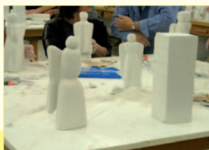
Engel aus Ytong