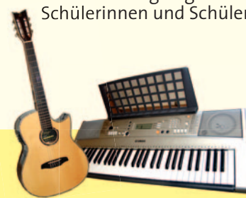
Gitarren und Keyboard