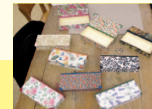
Schachteln nach Buchbinderart

Hier werden viele unterschiedliche Kurse angeboten, die gut besucht werden. Jeder, der Freude an gemeinsamen Aktionen hat, kann anbieten und teilnehmen. Diese Veranstaltungen sind kostenlos. Spenden sind aber immer willkommen.