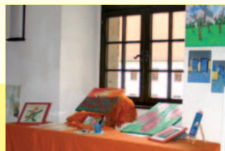
Präsentation des Schulvereins an den Schulkulturtagen